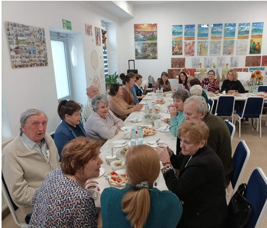
Spotkanie integracyjne z uczestnikami Klubu Senior+ w Mińsku Mazowieckim