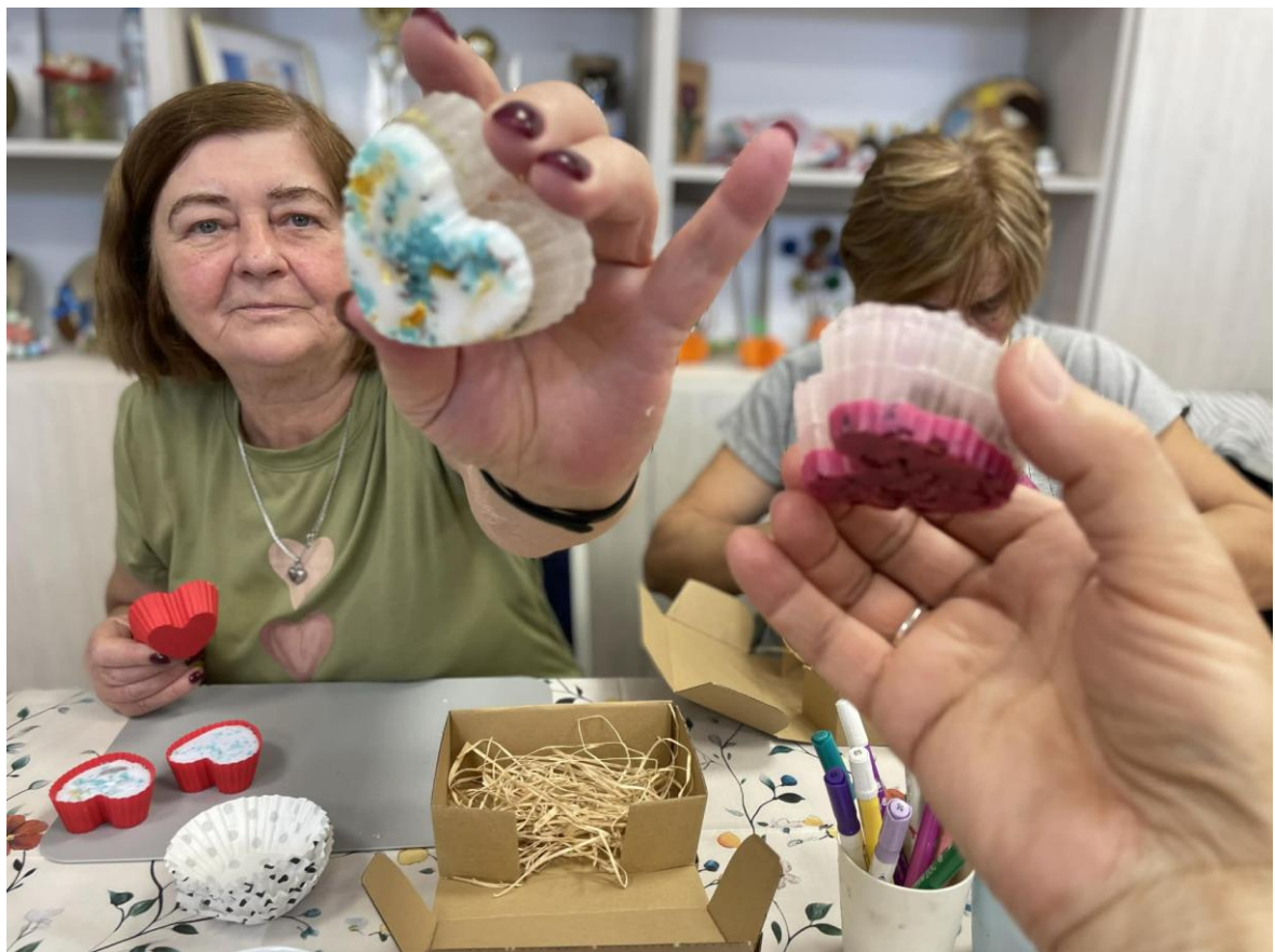
Warsztaty pn. „Akademia artystyczna Seniora” w ramach projektu „Bony dla Seniorów III”