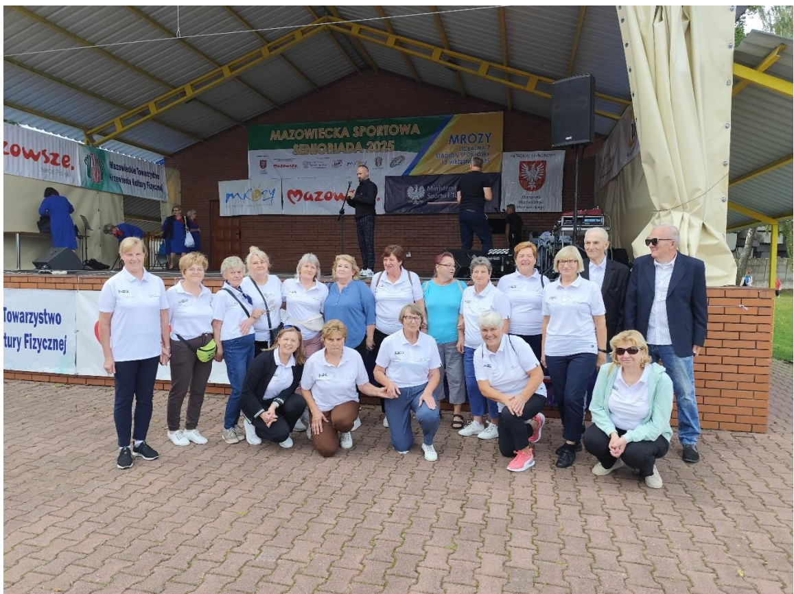
Mazowiecka Sportowa Seniorada 2025 w Mrozach