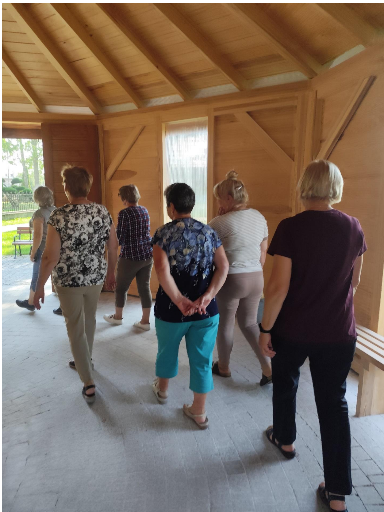
Haloterapia w tężni solankowej w Latowiczu