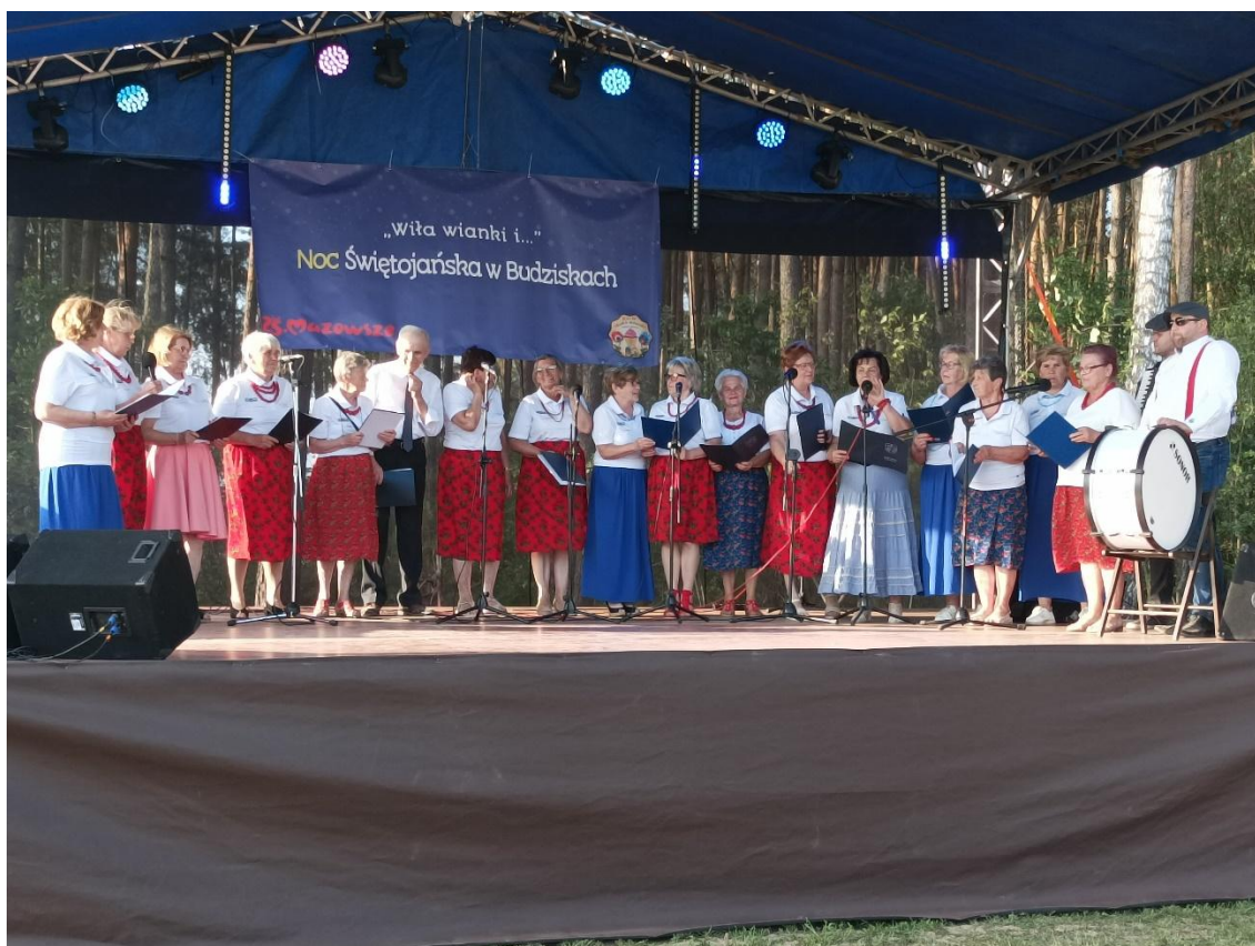
„Noc Świętojańska w Budziskach” - występ muzyczny Seniorów