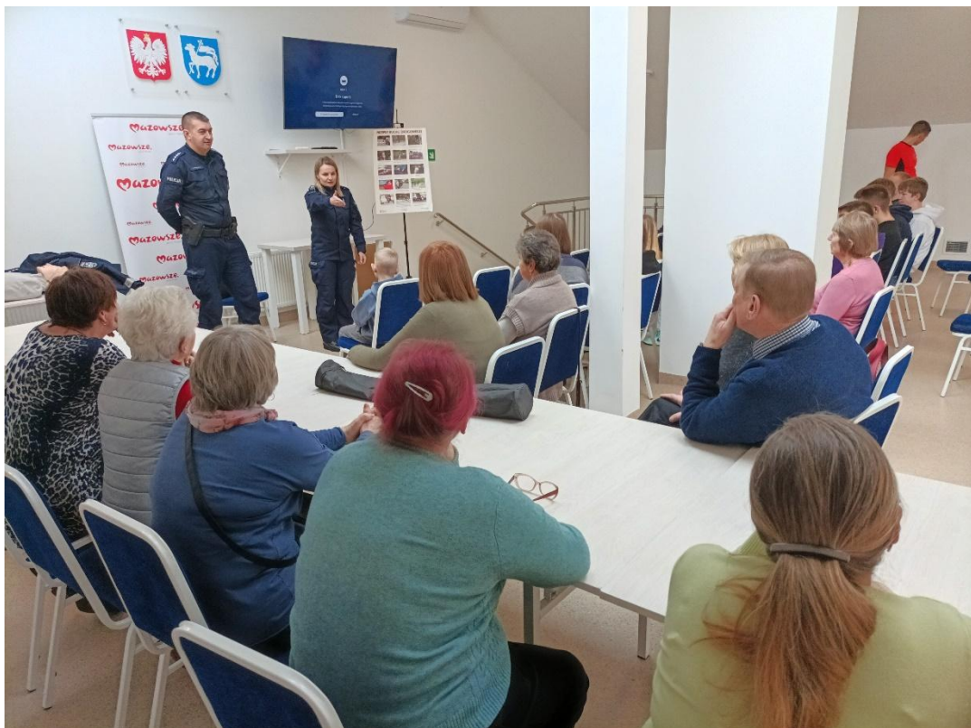
Spotkanie z Policją - „Seniorze, babciu i dziadku nie daj się oszukać. Bądź bezpiecznym!”