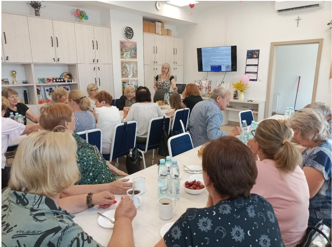
Wykład o tematyce prozdrowotnej w ramach projektu Pakiety Edukacyjne dla Mazowieckich Seniorów