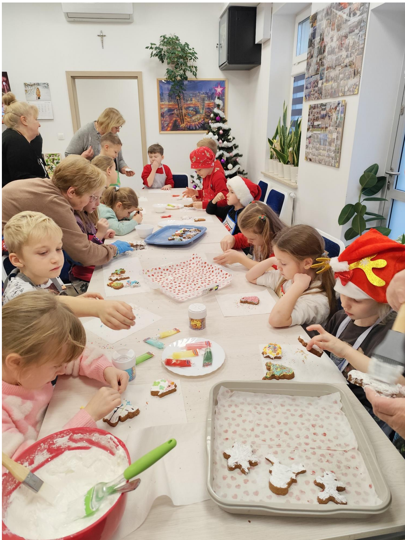
Międzypokoleniowe warsztaty kulinarne - wypiekanie i ozdabianie pierników