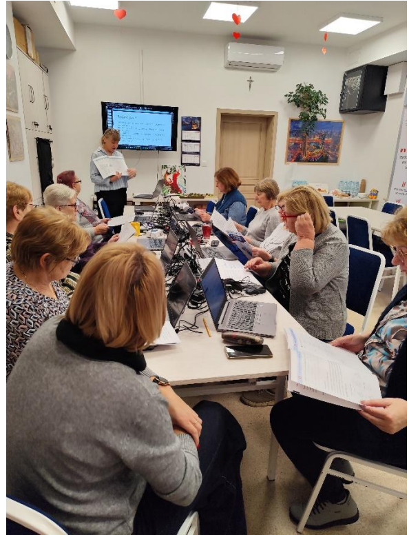
Warsztaty „Włączamy cyfrowo Mazowsze - szkolenie z kompetencji cyfrowych”