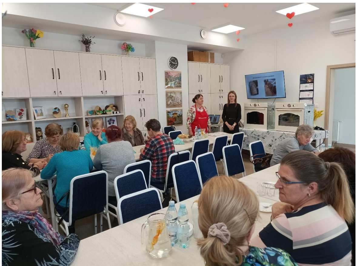
Warsztaty Pieczenia Chleba – Mazowieckie Dobre Praktyki i Tradycje Kulinarne