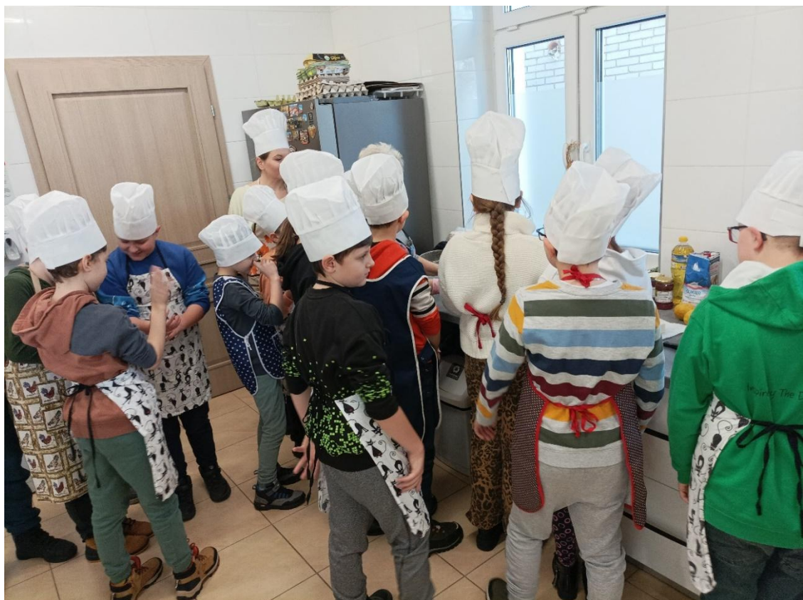
Międzypokoleniowe warsztaty kulinarne