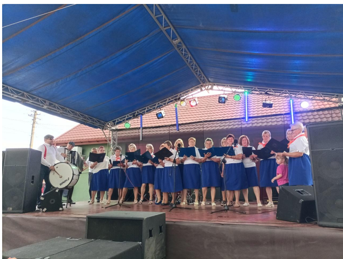
„Bezpieczne Wakacje z Ochotniczą Strażą Pożarną w Latowiczu” – występ muzyczny Seniorów