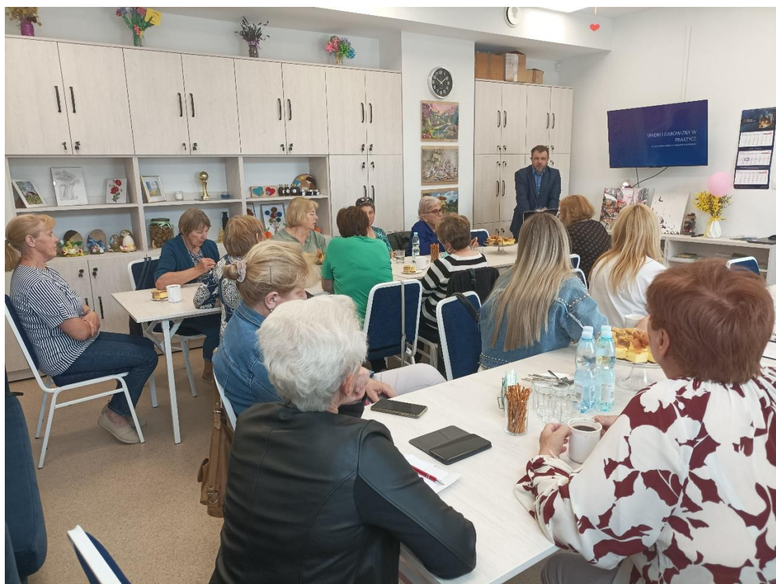
Wykład o tematyce prawnej w ramach projektu Pakiety Edukacyjne dla Mazowieckich Seniorów