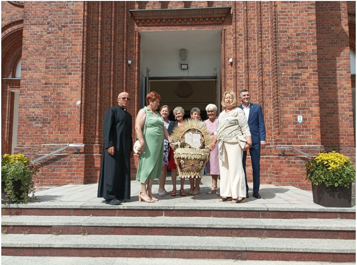
Udział w Dożynkach Parafialnych