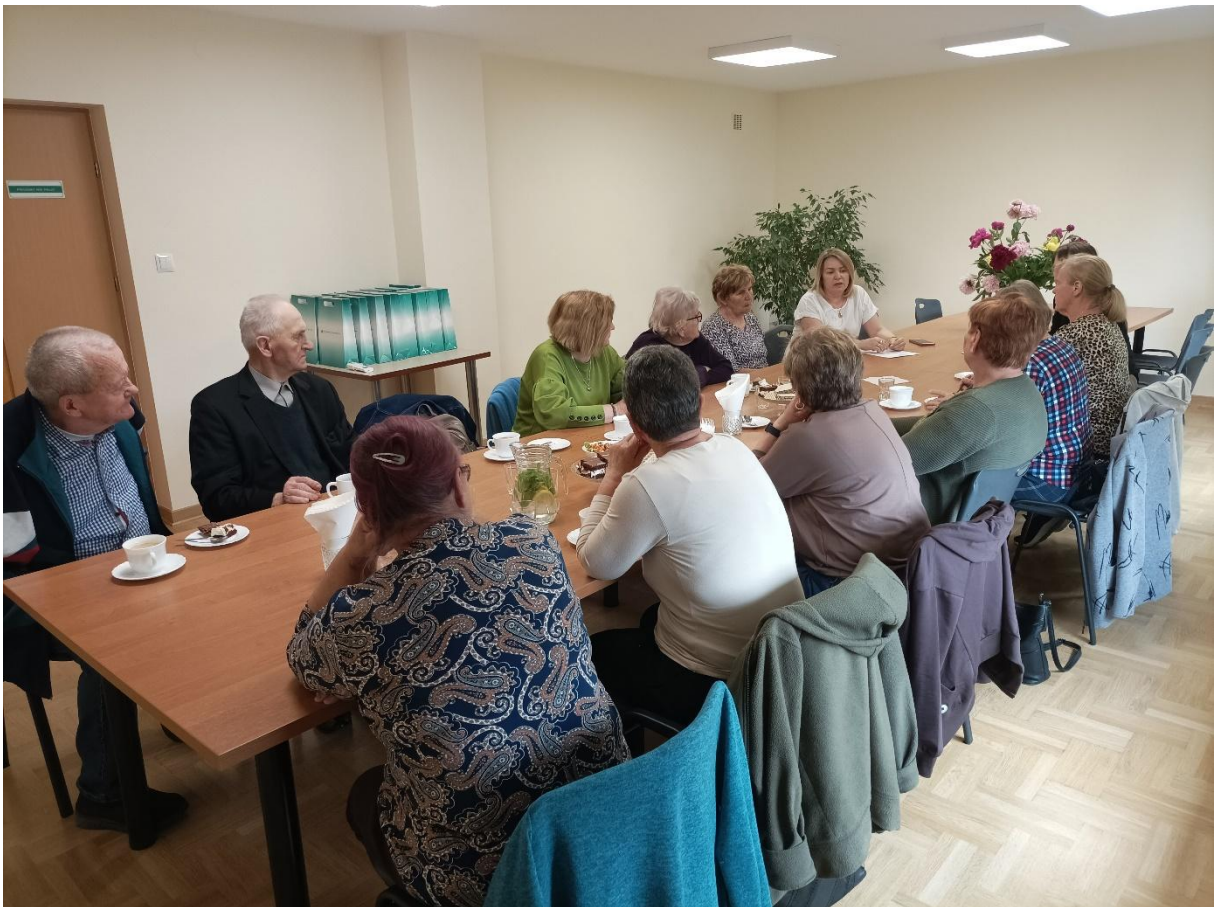
Wizyta w Banku Spółdzielczym w Latowiczu – „Zasady bezpiecznego bankowania”