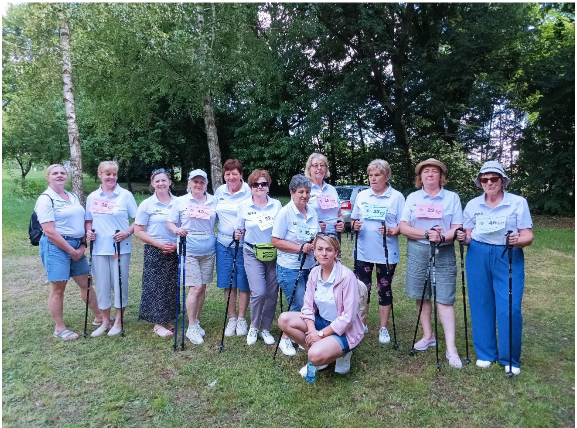
Turniej sportowy „EURO 2025” w Klubie Senior+ w Siennicy