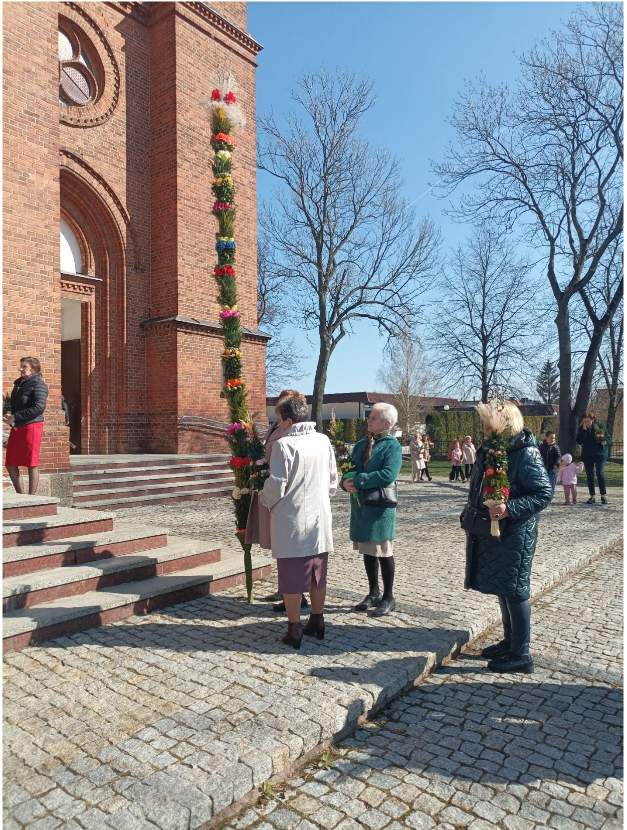
Udział w pochodzie z własnoręcznie wykonaną palmą w Niedzielę Palmową