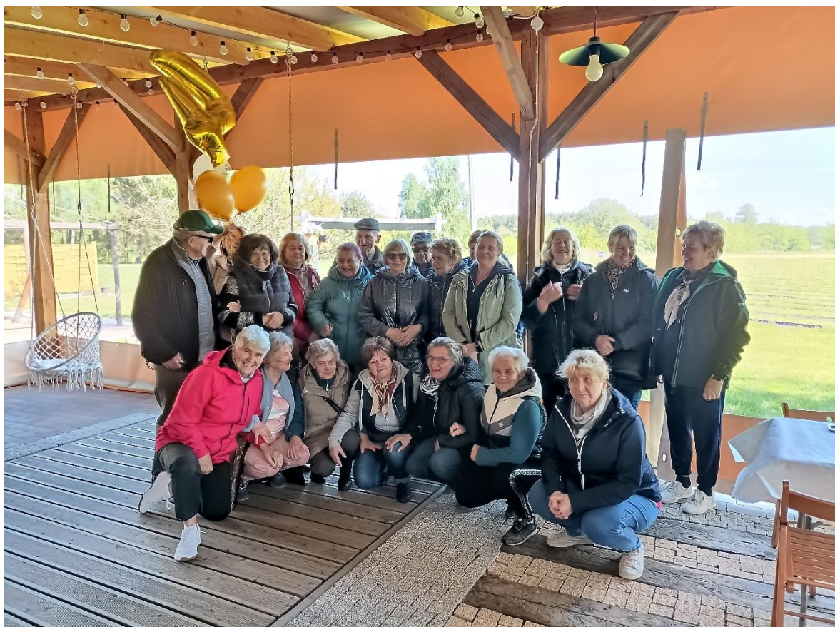
Obchody 4 rocznicy powstania Klubu Senior+ w Latowiczu