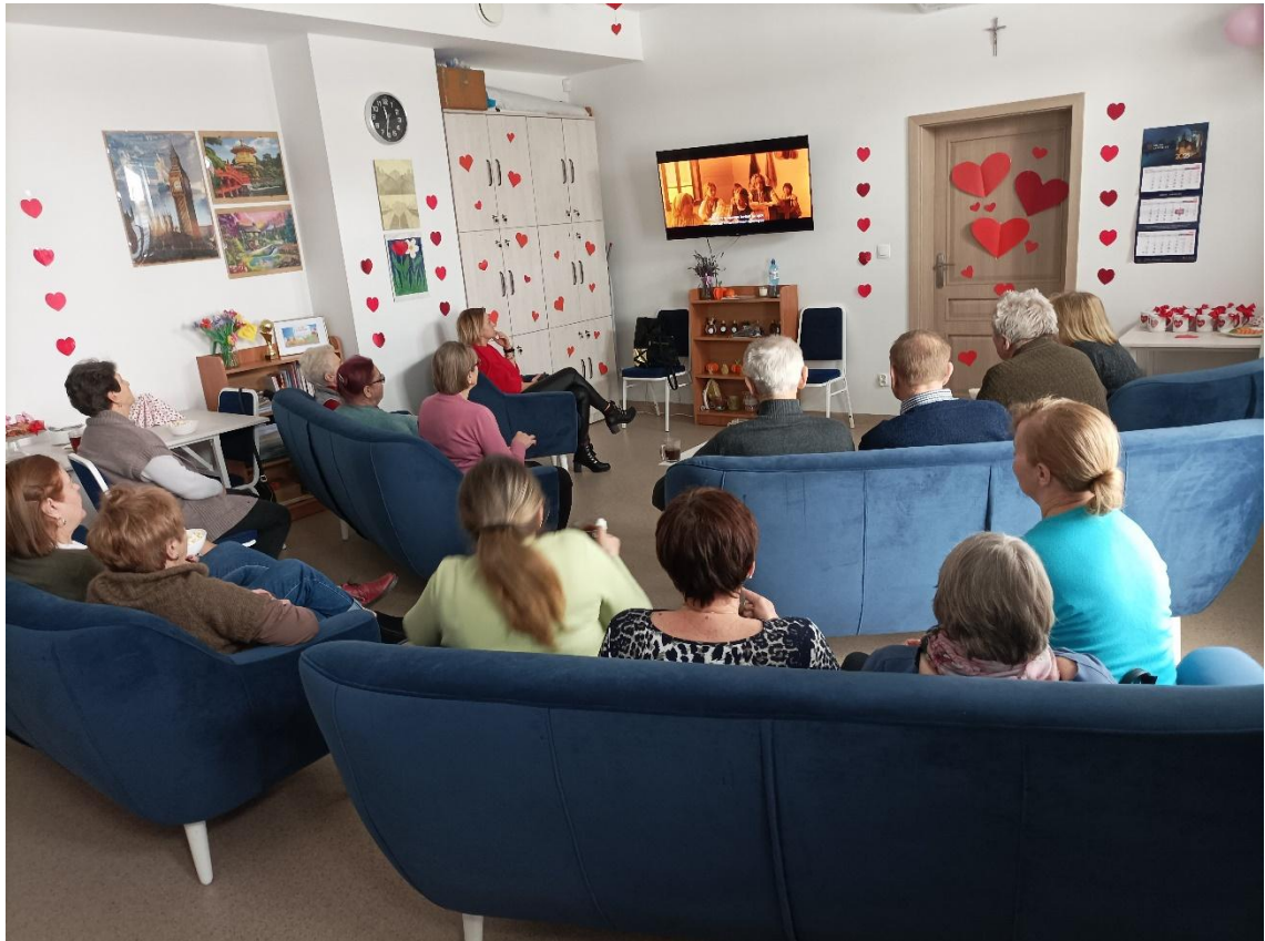
Kino dla Seniora