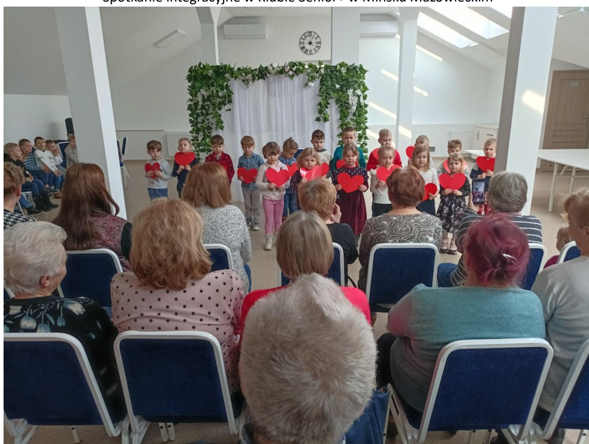
Wizyta dzieci z okazji Dnia Babci i Dziadka