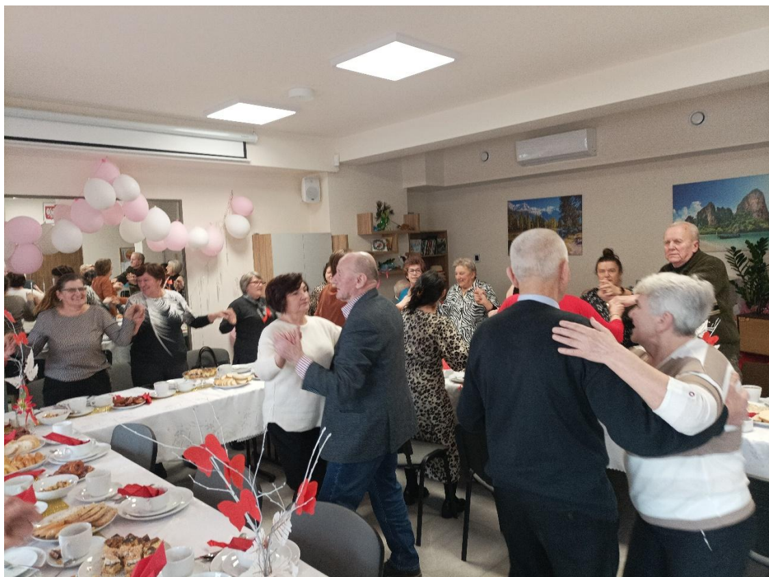
Spotkanie integracyjne w Klubie Senior+ w Mińsku Mazowieckim